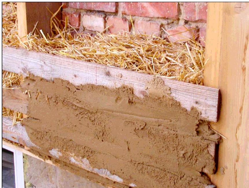
3 pav. Tarpai tarp lentų ir lentų paviršius padengiami moliniu skiediniu www.nachhaltigkeit.at/bibliothek/tatenbank/de/f0002064.pdf .

Kadangi mediniam karkasui, tarp kurio sudedami presuotų šiaudų ryšuliai, sunaudojama daug medienos, be to jis yra kaip ilginis šiluminis tiltelis, todėl šiuo metu kuriamos apšiltinimo