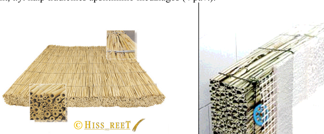
4 pav. Nendrių demblių naudojimas pastatų apšiltinimui

Siekiant paspartinti pastatų apšiltinimo darbus kai kuriose šalyse pramoniniu būdu gaminamos šiaudų su rišikliais presuotos plokštės, nendrių dembliai, kurie tvirtinami ankeriais ir klijuojant, t.y. kaip tradicinės apšiltinimo medžiagos (4 pav.).