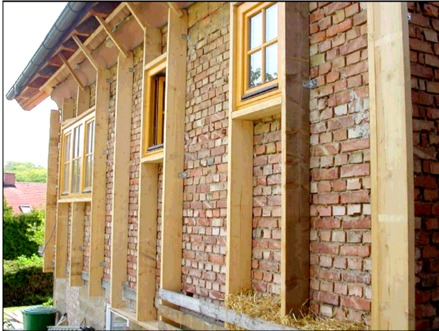
2 pav. Medinis karkasas sienos apšiltinimui www.nachhaltigkeit.at/bibliothek/tatenbank/de/f0002064.pdf

kad tarp jų standžiai išspaustų presuotų šiaudų ryšuliai (2 pav.). Iš išorės vertikalūs karkaso elementai apkalami lentomis su tarpais. Siekiant padidinti atsparumą degumui tarpai tarp lentų ir lentų paviršius padengiami moliniu skiediniu (3 pav.). Kaip galutinė apdaila gali būti armuotas tinko sluoksnis. Kitas apdailos variantas gali būti su vėdinamu oro tarpu ir dailylenčių ar lakštinių medžiagų apkalimu. Apšiltinant rąstinio namo sieną, pirmiausiai reikėtų užpildyti įdubas rąstų sandūrose. Tam galima naudoti molio tyrėje įmirkytus šiaudus arba iš šiaudų susuktas virves.